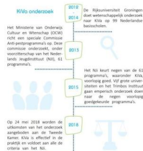
Bewezen effectief in het verminderen van pesten (ruim 63%)*